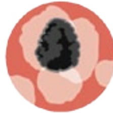
Lymphogranulomatose vénérienne (LGV)